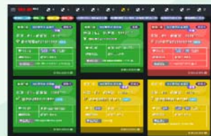
TED ER Platform