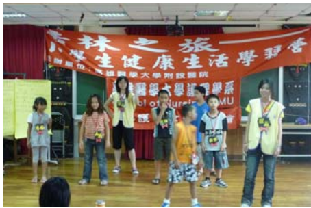
各小隊健康操表演