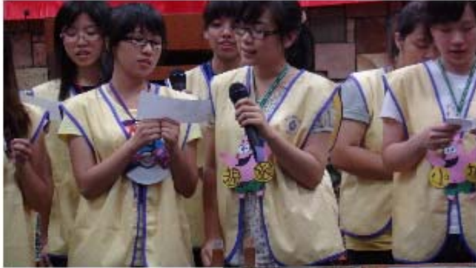
⇨ 青少年團契 詩歌演唱