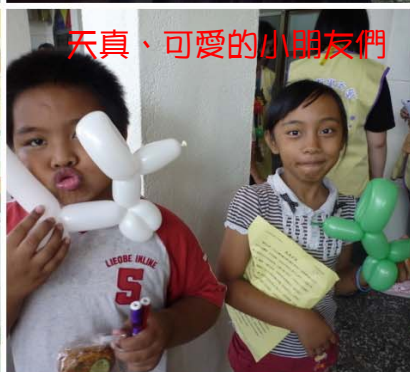
天真、可愛的小朋友們