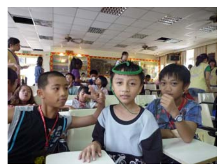
純真、自然的小朋友