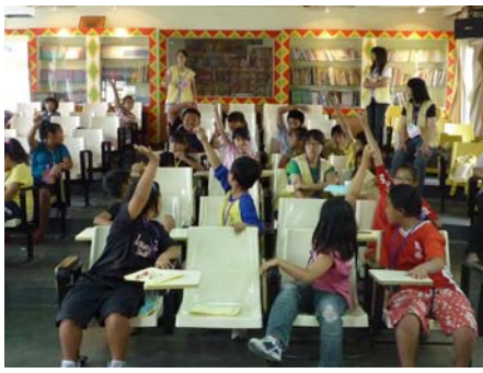
活潑搶答的小朋友