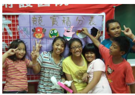
預備搶紀念名牌中