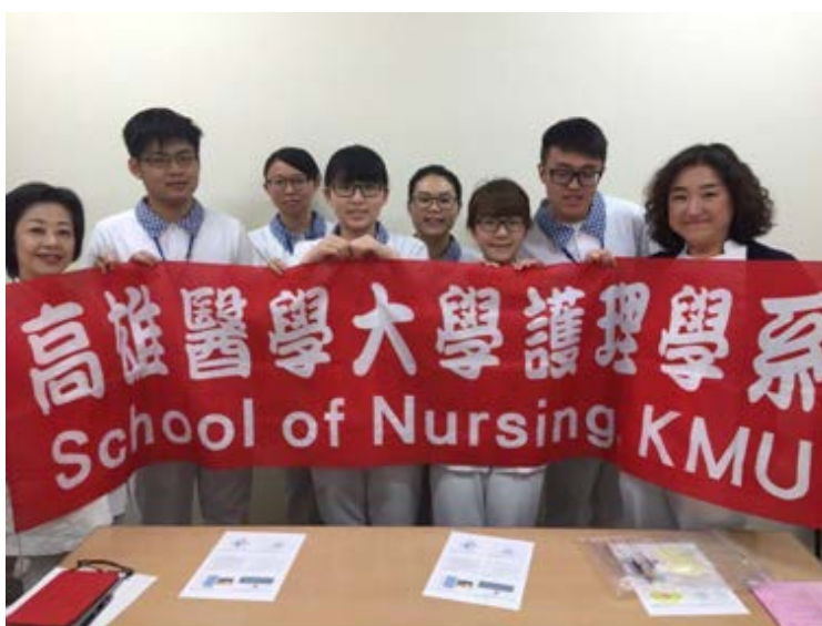
圖四、參訪聖路加國際醫院