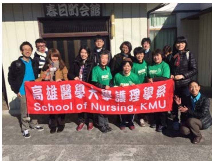
圖二、與秩父市社區人員合照