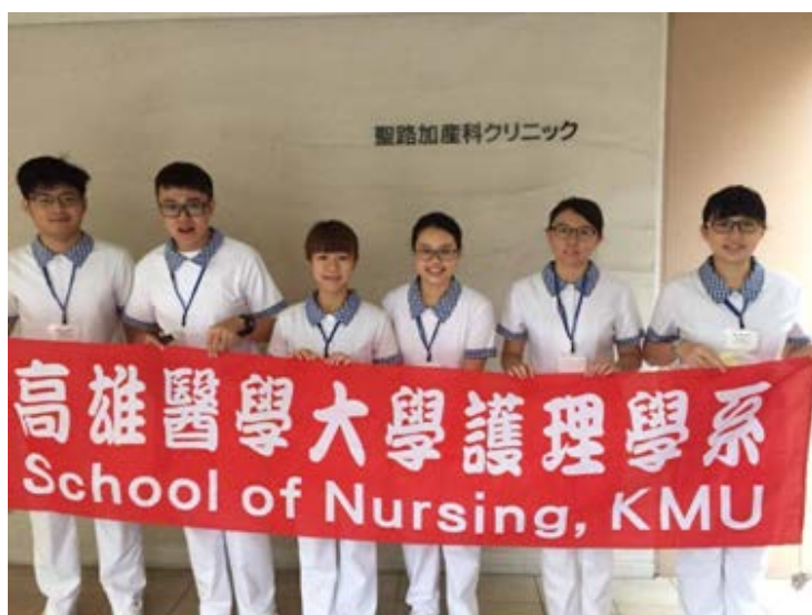
圖一、參訪聖路生產中心

透過此次機會能夠參訪他國醫療制度以及護理環境真的非常感動，聖路加國際大學課程也安排相當精彩，受益良多，也積極地希望將所見所聞應用至未來就業上，讓自己的護理工作更加精進，從自身做起慢慢改善台灣醫療環境。