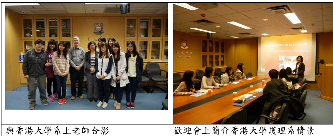
與香港大學系上老師合影

這次的行程雖然不能說很順利，過程中也是經歷許多小插曲，但感謝成員間的互相包容、扶持，也很謝謝學校老師做我們的後盾，讓我們都可平安的結束這次的交流，這次的交流真的讓我覺得很值得！