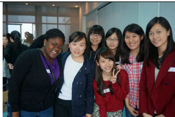
香港大學為三所交換學生所舉辦的歡迎餐會