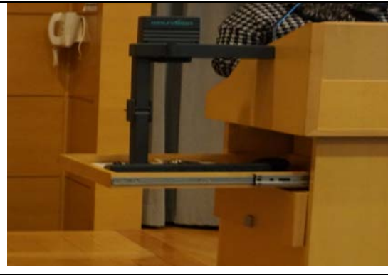
新穎設備可將手寫筆記及技術實物投影在大螢幕

在這 10 天的課程裡，幾乎都在大講堂上課，跟高醫護理系一樣用 PPT 上課，但不同之處，在講桌旁有放一台機器，可將老師要給同學看的東西投影在大螢幕並實際操作，讓同學在第一時間清楚明瞭，若不懂可立即發問，老師在實習操作解答問題。