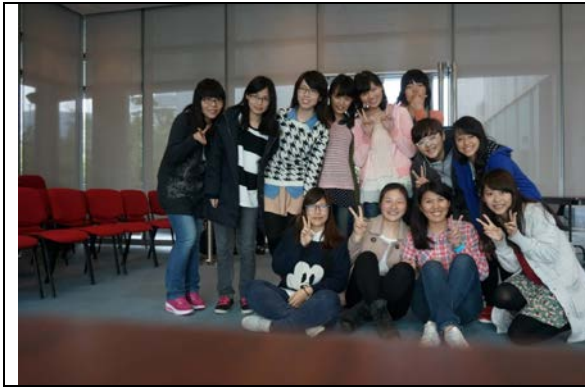
與中國人民解放軍第二軍醫大學學生合影