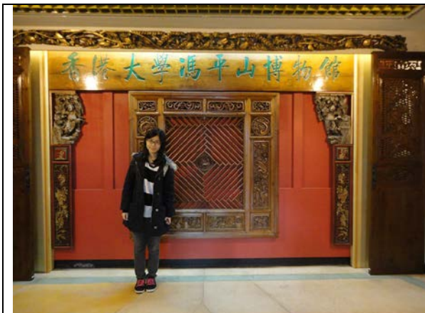
至香港大學馮平山博物館參觀